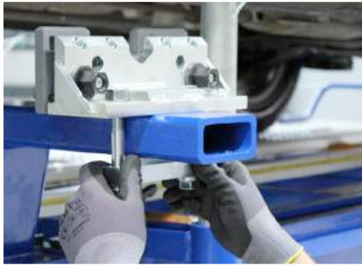
通用夾具和四點固定夾具；強大的固定力，沒有絲毫滑動的空間

BenchRack系統不僅可以增加您的設備的生產率，還增加技師的效率。在升降平台的輔助下，技師將始終以最舒適的姿勢工作；當您舉升車輛，在底盤與鈹金手術台間創造了足夠的活動空間。我們的特殊固夾具可以將BenchRack組件鎖定在鈹金手術台上，以確保車輛安全。