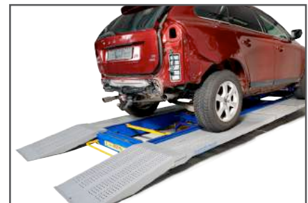
直接將車輛駛上手術台，輕鬆上架