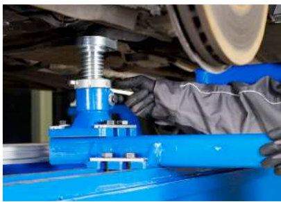
EVO 1, 2 和 3 萬用夾具系統，有效節省購買或租賃配件的成本