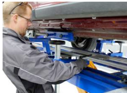
傑出的千斤頂和搖臂支架使車輛安裝快速，安全，方便