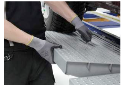
可拆卸坡道可輕鬆拆下，方便接近修復車輛