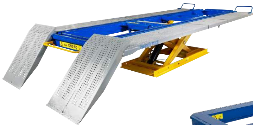
BenchRack, 4200 - 6300